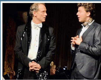
KOPPEL & SØN - synger "DE STORE MESTRE" 14.04.2023 kl.20 på Elværket