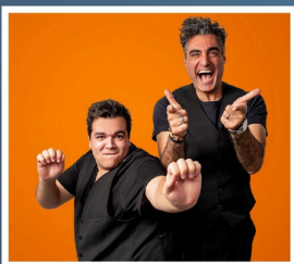
TO TOSSER PÅ TUR 30.09.2022 kl.19 i Parkteatret