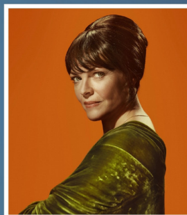
TA' MIG SOM JEG ER -en musikforestilling om Grethe Ingmann 07.01.2023 kl.16 i Parkteatret