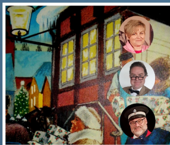
JUL I DEN GAMLE KØBMANDSBUTIK 26.11.2022 kl. 16 på Elværket