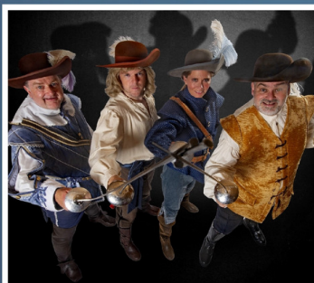
DE TRE MUSKETERER - en-for-alle og alle-for-en ... og tre for en tier 10.02.2023 kl. 20 på Gymnasiet