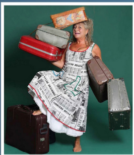
ALDER INGEN HINDRING 05.11.2022 kl.16 på Elværket