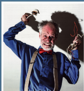
DET FORSØMTE FORÅR 17.03.2023 kl.19 på Elværket